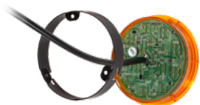
Adattatore per Basic 80