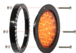
Adattatore per Basic 102